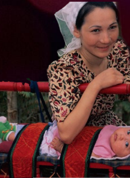
مەنبە: يازغۇچىنىڭ ئوكيان تورىغا بېسىلغان ماقالىسىغا ئاساسەن تەييارلاندى.

بىرىنچى، بۆشۈك بالىلارنىڭ بەدەن قۇرۇلمىسىنى كىچىكىدىن باشلاپ ئۆلچەملىك يېتىلدۈرۈشكە پايدىلىق. بۆشۈككە چوڭ بولغان بالىلاردا ئادەتتە دوقا، دوڭ، توخو تۇش(دۆڭ مەيدە)، ئىچ مايماق، تاش مايماق، سىڭا سۆڭەك، مۇرىلىرى ئېگىز - پەس، بويىنى مائىتۇق، پەچەك(پاقالچاقلىرى O شەكىللىك) بولۇپ قېلىشتەك ئالامەتلەر كۆرۈلمەيدۇ. ئىككىنچى، بۆشۈككە بۆلەنگەن بالىدا ئاسانلىقچە ئۆپكىسى شامالداپ قالىدىغان، ئېغىر يۆتىلىدىغان، زۇكام بولىدىغان ئەھۋاللار يۈز بەرمەيدۇ. ئۈچىنچى، بۆشۈك جابدۇقلىرى قەرەللىك ئاپتاپقا قاقلىنىپ، قۇرۇق ھەم ئىسسىق ساقلانغانلىقى ئۈچۈن، ۋاقلاردا تولا سىيىپ سۈيىدۈك يېپىۋېتىدىغان، ئەنگىزى ئېشىپ كېتىدىغان، قەغىشلىق قىلىدىغان ئەھۋال كۆرۈلمەيدۇ.