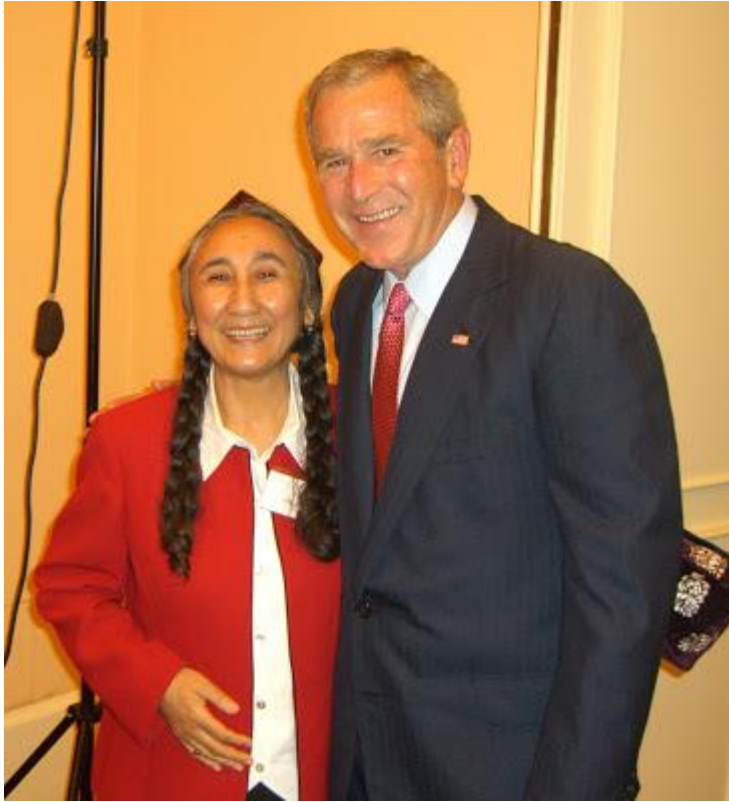
رابعه خانم ئامېرىكا سابو- رهئسى بوش بىلەن 26/06/2006