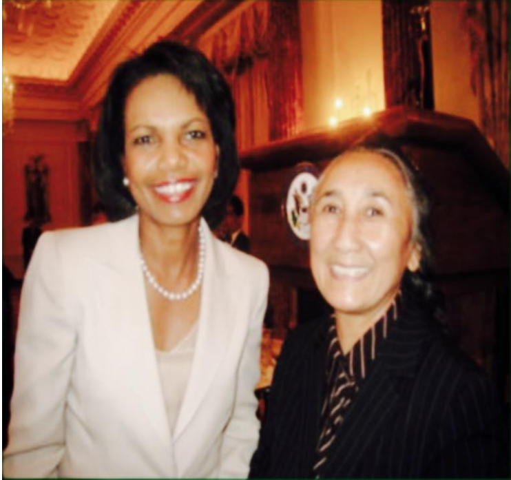
رابیہ خانم ٹامہریکا سابقہ تاشقی ئشیلار منسٹری ریس خانم بلہن بللہ