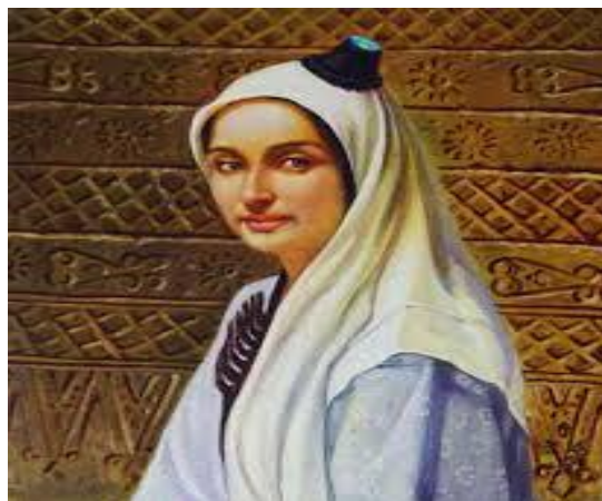
(ئۇيغۇر خانىم - قىزلىرىمىزنىڭ ئەنئەنىۋى ئورۇنۇش ئۇسۇلى)