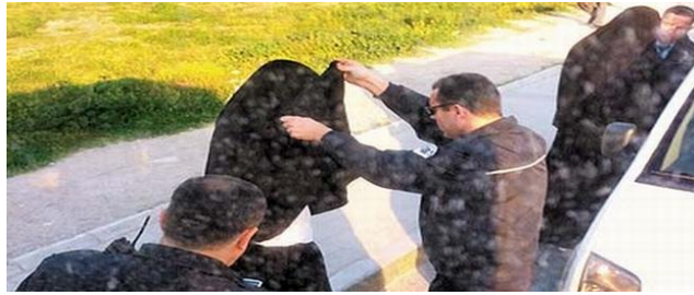
ئاللاھ تەئالا مۇنداق دەيدۇ:

لَا يَجِلُّ لَكَ النِّسَاءُ مِنْ بَعْدُ وَلَا أَنْ تَبَدَّلَ بِهِنَّ مِنْ أَزْوَاجٍ وَلَوْ أَعْجَبَكَ حُسْنُهُنَّ إِلَّا مَا مَلَكَتْ يَمِينُكَ وَكَانَ اللَّهُ عَلَى كُلِّ شَيْءٍ رَقِيبًا