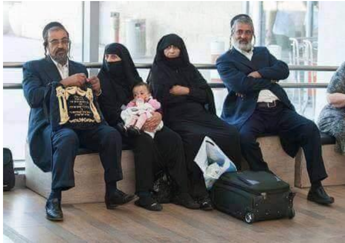
(ئورتادوكس يەھۇدىلىرىدىكى ئورنىشتىن بىر كۆرۈنۈش)