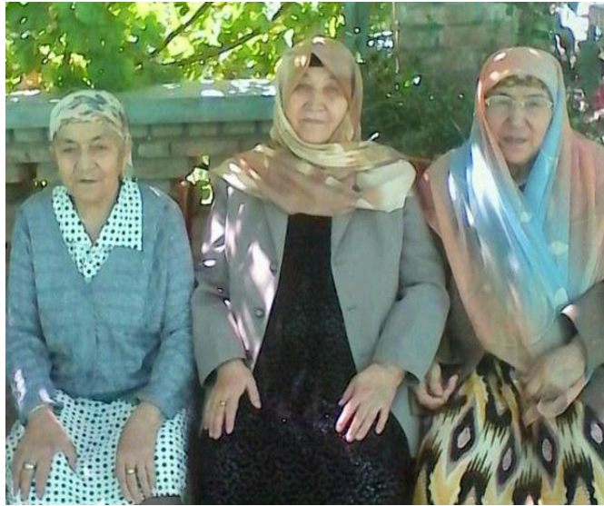
(ئۇيغۇر ئەنئەنىۋى ئۇسۇلدا ئورانغان ئۇيغۇر ئانىلار)