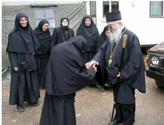
(ئورتادوكس خىرىستىيانلىرىنىڭ كىيىم-كېچەكلىرىدىن بىر كۆرۈنۈش)