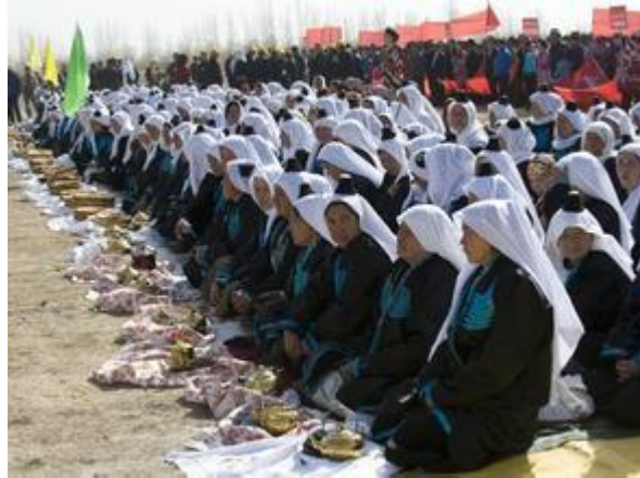
(ۋەتىنىمىزنىڭ كېرىيە ۋە چىرىيەگە خاس مىللى باش كىيىملىرى)