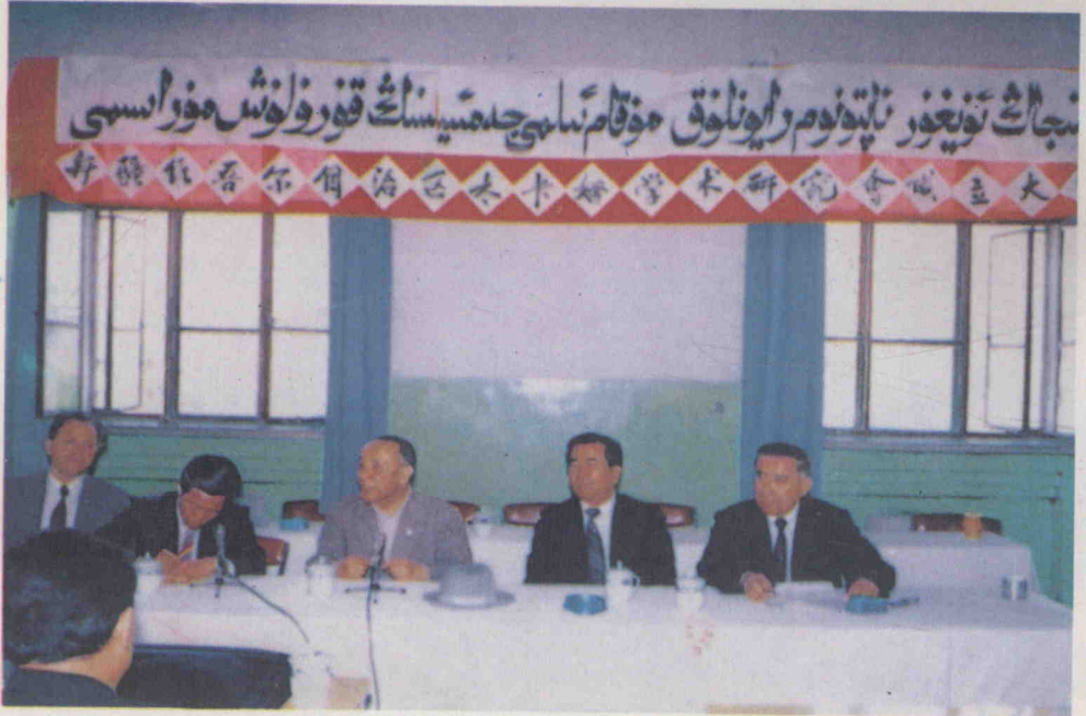
شىنجاڭ ئۇيغۇر ئاپتونوم رايونلۇق مۇقام ئىلمىي جەمئىيىتىنىڭ قۇرۇلۇش مۇراسىمىدا