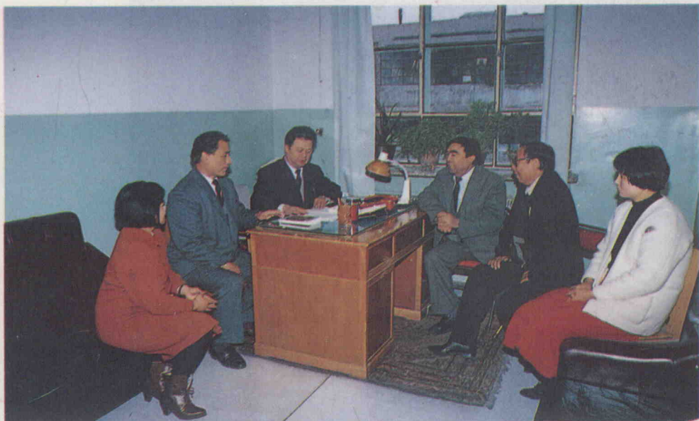
شىنجاڭ خەلق نەشرىياتىدىكى مۇھەررىرلەر «ئۇيغۇر ئون ئىككى مۇقامى ھەققىدە» دېگەن كىتاب ئۈستىدە سۆھبەتلەشكەن