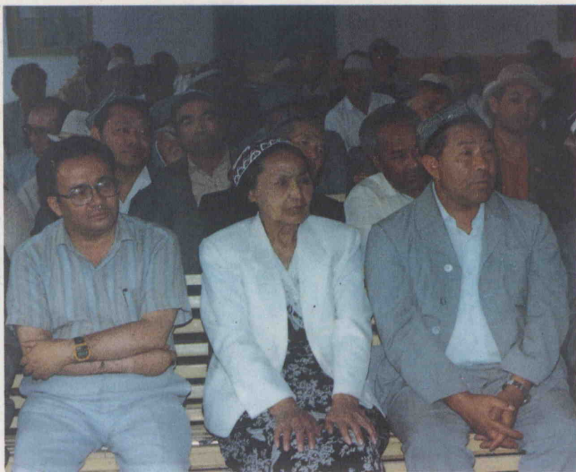
ئون ئىككى مۇقام ئىلمىي مۇھاكىمە يىغىنىنىڭ گۇرۇپپا يىغىنىدا