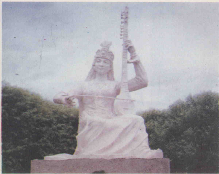
مەلىكە گامانساخاننىڭ ھەيكىلى