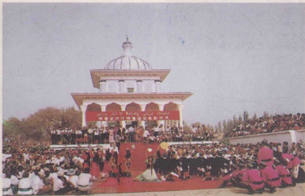
مەلىكە گامانساخاننىڭ قەبرىگاھى ئالدىدا