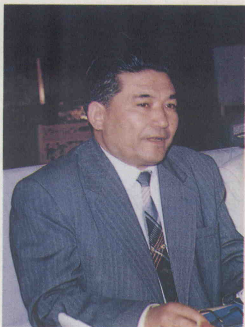
ئاپتونوم رايونلۇق خەلق ھۆكۈمىتىنىڭ مۇئاۋىن رەئىسى قېبۇم باۋۇدۇن مۇقام تەتقىقاتى ھەققىدە يوليورۇق بەرمەكتە