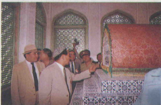
رەئىس تۆمۈر داۋامەت گامانساخاننىڭ قەبرىسىنى زىيارەت قىلماقتا .