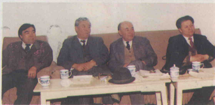
بىر قىسىم ئالىم - مۇتەخەسسسلەر مۇقام ھەققىدىكى ماقالىلار ئۈستىدە سۆھبەتلەشكەن