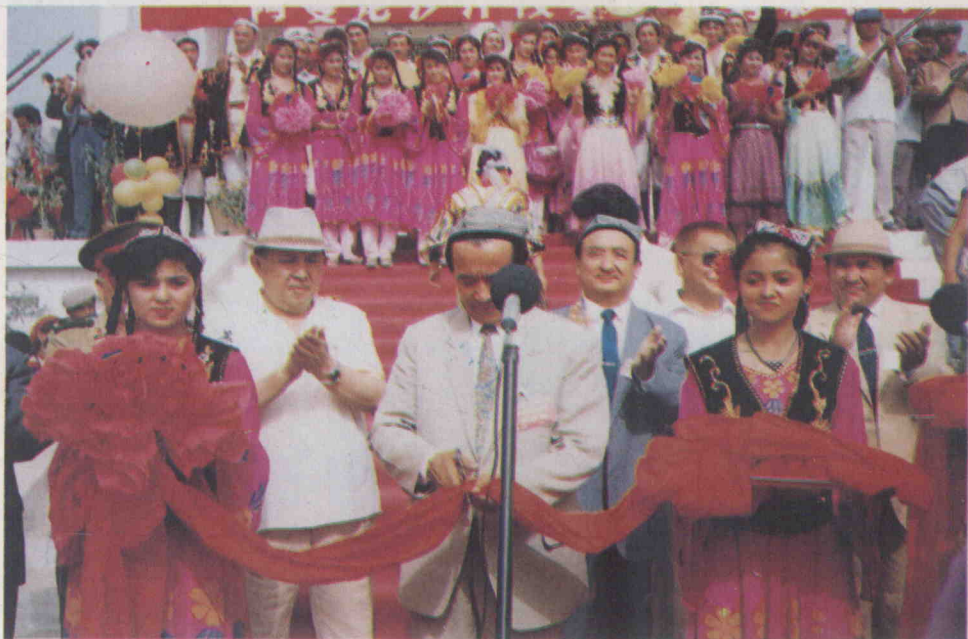
رەئىس تۆمۈر داۋامەت لېنتا كەسمەكتە