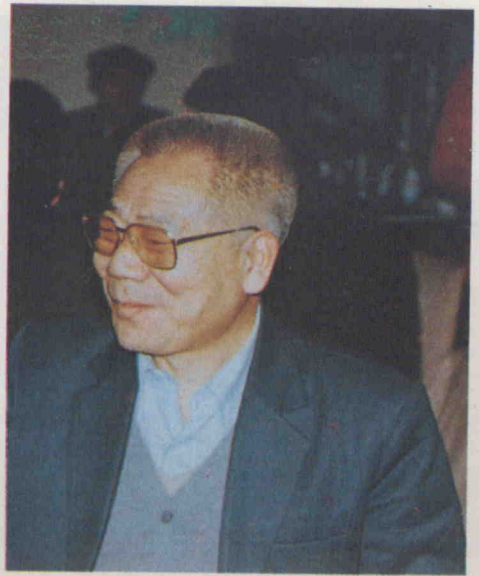
يولداش فىڭ داچىن مۇقام ھەققىدە سۆھبەتلەشە كەتتە