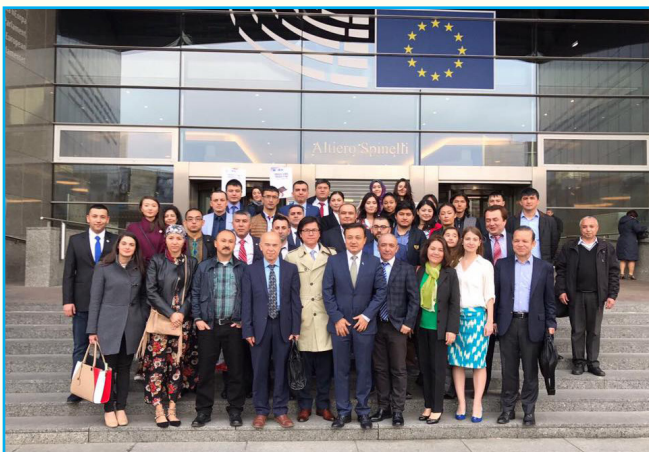
2017 - يىلى 30 - مارت: شىنخۇا ئاگېنتلىقى،

2017 - يىلى 30-مارت: د ئۇ ق نىڭ 12-نۆۋەتلىك «ئۇيغۇر رەھبەرلىرىنى دېموكراتىيە، كىشىلىك ھوقۇق، قانۇن بىلەن تەربىيەلەش پروگراممىسى» باشلاندى؛ مەخسۇس ئۇيغۇر ياشلىرىنى تەربىيەلەشنى نىشان قىلغان بۇ قېتىمقى كۇرسقا ھەرقايسى ئەللەردىن تىزىمغا ئالدۇرغان 50 ئەتراپىدا ۋەكىللەر قاتناشتى. كۇرسنىڭ ئۈچ كۈن داۋاملىشىدىغانلىقى قەيت قىلىندى.