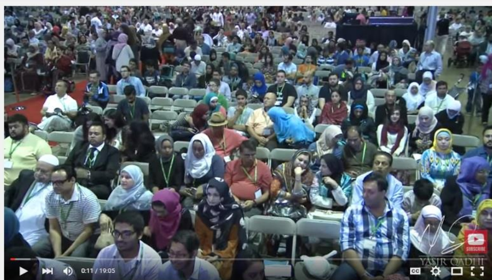
Doubts about Islam - Guidance for Challenging Times ~ Dr. Yasir Qadhi

تۆۋەندىكىسى ياسىر قازىنىڭ «ئىسلام ھەققىدىكى گۇمانلار - ھازىرقى قىيىن ۋاقىتلار ئۈچۈن كۆرسەتمە» دېگەن دوكلاتىنىڭ مەزمۇنى. كىچىك تېمىلارنى مەن ئۆزۈم قويدۇم. ئەگەر ئەسلىدىكى مەزمۇنغا مەن ئۆزۈمنىڭ كۆز-قاراشلىرىنى قوشۇپ قويماقچى بولسام، ئۇلارنى بىر «ئىلاۋە» شەكلىدە قىستۇرۇپ قويىمەن.