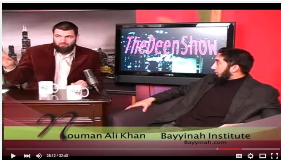
4-رەسىم: سۆھبەتنىڭ نەق مەيدانىدىن يەنە بىر كۆرۈنۈش.