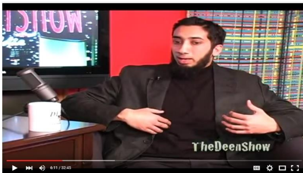
3-رەسىم: ئويغان سوئاللارغا جاۋاب بېرىۋاتقاندىكى بىر كۆرۈنۈش.

مەن ئىسلامغا قايتىپ كېلىشتىن بۇرۇن باشقا دىنلار ئۈستىدە ئىزدىنىپ باقمىدىم. ئەمما ئۇنىۋېرسىتېتتا كۆپلىگەن پەلسەپە دەرسلىرىنى تاللاپ ئوقۇدۇم. ئۇ دەرسلەر مېنى دىندىن تېخىمۇ يىراقلاشتۇردى. يەنى، پەلسەپە دەرسلىرىدە دىنلار ھەققىدە سۆزلىگەندە، باشقا دىنلار مېنى ناھايىتى ھودۇقتۇردى. ئۇ دىنلار ھەققىدىكى ئەڭ دەسلەپكى چۈشەندۈرۈشنى ئوقۇپلا، ئۇنىڭ داۋامىنى ئوقۇغۇم كەلمىدى. يەنى ئۇلار مەن ئۈچۈن ئەقىلگە ئۇيغۇن كەلمىدى. سىز ئادەتتە بىر دىن ھەققىدە ئازراق ماتېرىيال كۆرۈپ، ئۇنىڭ ئەقىلگە ئۇيغۇن كەلمەيدىغانلىقىنى بايقايدىكەنسىز، «ھەممە دىنلار مۇشۇنداق بولىدۇ»، دەپ ئويلاپ قالسىز. بۇنداق ئىشلار ناھايىتى كۆپ كىشىلەر ئۈچۈن يۈز بېرىپ تۇرىدۇ. مەن ئۇنىۋېرسىتېتتا بىر قىسىم ئىسلام پەلسەپىسىنىمۇ ئۆگەندىم. ئۇ دەرسنى «خۇدا بار بولۇشىمۇ مۇمكىن، يوق بولۇشىمۇ مۇمكىن» دەپ قارايدىغان بىر تارىخ پروفېسسورى ئۆتكەن بولۇپ، ئۇ چاغدا مەن ئىسلامدىكى ئۆزۈمنى جەلپ قىلىدىغان بىرەر نەرسىنى ئۇچراتمىدىم. ئەمما شۇ چاغدىن باشلاپ كۆڭلۈمنىڭ چوڭقۇر بىر يېرىدە «ئىسلام يالغۇز بىر ئىلاھىيەتكە تەۋە نەرسە بولۇپلا قالماي، ئۇ يەنە ئەقلىيەتكە تەۋە نەرسە ئىكەن»، دېگەن چۈشەنچە شەكىللىنىشكە باشلىدى.