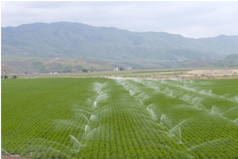
2-رەسىم: سۇ ۋە دېھقانچىلىق.

يامغۇر ياغقاندا بىر خىل ئۆسۈملۈكلەر ئۆزۈڭىدىن مېۋە بېرىدۇ. يەنە بىر خىل ئۆسۈملۈكلەر بولسا پەقەت سىز پەرۋىش قىلغاندىن كېيىنلا ئاندىن مېۋە بېرىدۇ. خۇددى شۇنىڭغا ئوخشاش، بىر خىل كىشىلەر سىز ھېچ قانداق دەۋەت قىلمىسىڭىزمۇ ئاللاھنىڭ كىتابى يۈرىكىگە كىرىش بىلەن ئىسلامغا ئۆزۈڭىدىن كىرىدۇ. بۇنداق ئەھۋال بۈگۈنكى كۈندىمۇ يۈز بېرىۋاتىدۇ. ئۇلار پەقەت ئاللاھنىڭ ئىرادىسى بىلەنلا ئىمان ئېيتىۋاتىدۇ. مەن ئاشۇنداق كىشىلەرنى داۋاملىق ئۇچرىتىپ تۇرىمەن. ئىنسانشۇناسلارنىڭ دېيىشىچە، ئىنسانلارنىڭ مەدەنىيەتلىشىشى دېھقانچىلىقنى ئۆگەنگەندىن كېيىن ئاندىن باشلانغان. ئەگەر پەقەت جاڭگالدىكى يېمىش دەرىخىلىرىگىلا تايانغان بولسا، ئىنسانلار بۈگۈنگىچە ھايات قالايمىتتى. ئىنسانلار يېمەكلىكلەرنى كەڭ-كۆلەمدە ئىشلەپ چىقىرىشنى ئۆگىنىشكە مەجبۇرى بولغان. يەنى، دېھقانچىلىقنى تەرەققىي قىلدۇرۇپ، شۇ ئارقىلىق يېمەكلىكلەرنى كەڭ-كۆلەمدە ئىشلەپ چىقىرىدىغان بولغان. دېھقانچىلىق مەيدانغا كەلگەندىن كېيىن، شەھەرلەر بەرپا قىلىنغان. شەھەرلەردىن كېيىن دۆلەتلەر پەيدا بولغان، ھەمدە مەدەنىيەتلىشىش ۋۇجۇدقا كەلگەن. بۇلارنىڭ ھەممىسىنىڭ 1-قەدىمى دېھقانچىلىقتۇر.