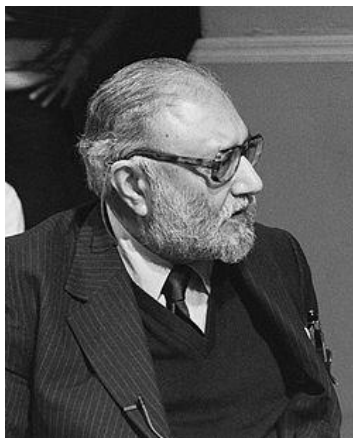
1-رەسىم: دوكتور مۇھەممەد ئابدۇل سالام

مەن بۈگۈن مۇھىمى ئىلىم-پەن ئۈستىدە سۆزلىمەكچىمەن. ئەگەر ئۆزىمىزنىڭ تامامەن ھەقىقەت بولغان ئىززەت-ئابدۇيىمىزنى ساقلايمىز دېسەك، ئالدى بىلەن ئەرەب ۋە ئىسلام ئەللىرىنىڭ ئىلىم-پەن ئىتتىپاقىدىكى ئىجادىيەت مەسىلىسىگە ئېتىبار بېرىشىڭلارنى، ھەمدە زۆرۈر بولغان پائالىيەت ۋە تەدبىرنىڭ قەدەم باسقۇچلىرىنى ئوتتۇرىغا قويۇشۇڭلارنى ئۈتۈنمەن. لېكىن مەن بۇ مەسىلىنى سۆزلەشتىن ئىلگىرى بىر نەچچە مىنۇت ۋاقىتلىرىنى ئېلىپ «زەررىچە فىزىكىسى» نىڭ بەزى تەرەققىياتلىرى، بولۇپمۇ ئېنېرگىيىنىڭ ئاساسى شەكىللىرى ۋە تەبىئەت كۈچلىرى بىلەن مۇناسىۋەتلىك بولغان بەزى مەسىلىلەر ئۈستىدە توختىلىپ ئۆتمەكچىمەن. بۇلار مەن شۇغۇللىنىۋاتقان ۋە تەتقىق قىلىۋاتقان ئىلمىي مەسىلىلەردۇر.