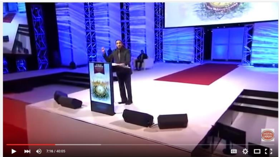
Islam is easy, We made it hard - Nouman Ali Khan 2015 (Thought provoking)

بىزگە قىلغان ئۇلۇغ سوۋغاتتۇر. ئوخشاش ئايەتتە ئاللاھ يەنە «بۇ ئاللاھ كۆرسەتكەن ياخشىلىق بولۇپ، بۇنداق ياخشىلىقنى ئاللاھ ئۆزى خالىغان كىشىلەرگە ئاتا قىلىدۇ. ئاللاھ ناھايىتى چوڭ ياخشىلىقلارنىڭ ئىگىسىدۇر»، دەيدۇ. ئاللاھ كىشىلەرگە ناھايىتى چوڭ ياخشىلىقلارنى ئاتا قىلىدۇ. كىشىلەرگە ئۈمىد بېغىشلايدۇ. ئەمما بىر قىسىم كىشىلەر پۇرسەتلا بولسا باشقىلارنى ئۈمىدسىزلەندۈرۈشكە تىرىشىدۇ. ئۇلار داۋاملىق «سەندە مۇناپىقلىق يوقلۇقىنى بىز قانداق بىلىمىز؟ ئىچىڭدە شېرىكىلىك يوقلۇقىنى بىز قانداق بىلىمىز؟ سەن قىلغان ئىشلارنىڭ ھېچ قايسىسى قوبۇل قىلىنمايدۇ، سەن دوزاخقا كىرسەن» دەيدۇ. بۇنداق كىشىلەرنىڭ ئوقۇيدىغىنى بىز ئوقۇغان قۇرئان بىلەن بىر كىتابمىدۇر؟