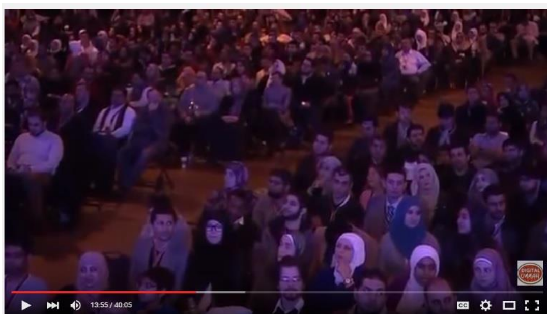
Islam is easy, We made it hard - Nouman Ali Khan 2015 (Thought provoking)

قىلمىن، بىرەر ساياھەت ئورنىغا تەكلىپ قىلمىن، بىرەر پروگراممىغا، ياكى بىرەر رېستورانغا تەكلىپ قىلمىن. يەنى، مەن كىشىلەرنى بىر مەنزىلگە تەكلىپ قىلمىن. مەن ھەرگىزمۇ كىشىلەرنى بىر يولغا تەكلىپ قىلمايمەن. بىز كىشىلەرنى يولغا تەكلىپ قىلماي، ئۇلارنى بىر مەنزىلگە تەكلىپ قىلمىن. ئۇلارنى يولغا تەكلىپ قىلساق ئەقىلگە ئۇيغۇن كەلمەيدۇ. ئەمما بۇ ئايەتتە ئاللاھ «كىشىلەرنى پەرۋەردىگارىڭ (master, lord) نىڭ يولغا تەكلىپ قىلغىن»، دەيدۇ. بۇ يەردىكى تەكلىپ بىر مەنزىلگە قارىتىلماي، بىر يولغا قارىتىلغان. شۇڭلاشقا بۇ تەكلىپ باشقا ھېچ قانداق تەكلىپلەرگە ئوخشىمايدۇ. بۇ قۇرئاندىكى بىر ئەڭ مۇھىم ھېكمەتتۇر.