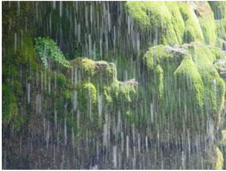
1-رەسىم: يامغۇر ۋۇجۇدقا كەلتۈرگەن ئورمانلىق.

ئالدىنقى ئايەتتە ئاللاھ يامغۇر سۈيىنى چۈشۈرگەنلىكىنى تىلغا ئالغان بولۇپ، بۇ يەردە بولسا قۇرئاننى چۈشۈرگەنلىكىنى تىلغا ئالدى. يەنى ئاللاھ ئاسماندىن چۈشۈرۈلگەن قۇرئاننى ئاسماندىن چۈشۈرۈلگەن يامغۇر سۈيىگە سېلىشتۇردى. ئاسماندىن چۈشكەن يامغۇر سۈيى يەرگە سىڭىپ كېتىدۇ. ئاسماندىن چۈشكەن ئايەتلەر ئىنسانلارنىڭ يۈرىكىگە كىرىپ كېتىدۇ. يەر يۈزى بۇرۇن ئۆلۈك بولۇپ، ئۇ يامغۇر سۈيىنىڭ كۈچى بىلەن تىرىلگەن. بۇرۇن كىشىلەرنىڭ قەلبىمۇ ئۆلگەن بولۇپ، ئۇ ئاللاھنىڭ كىتابىنىڭ قۇدرىتى بىلەن قايتىدىن تىرىلگەن، ۋە تىرىلىدۇ.