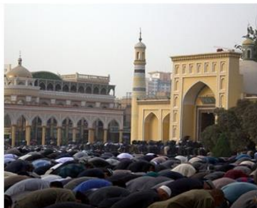
1-رەسىم: پەننىي ئوقۇش ۋە ناماز