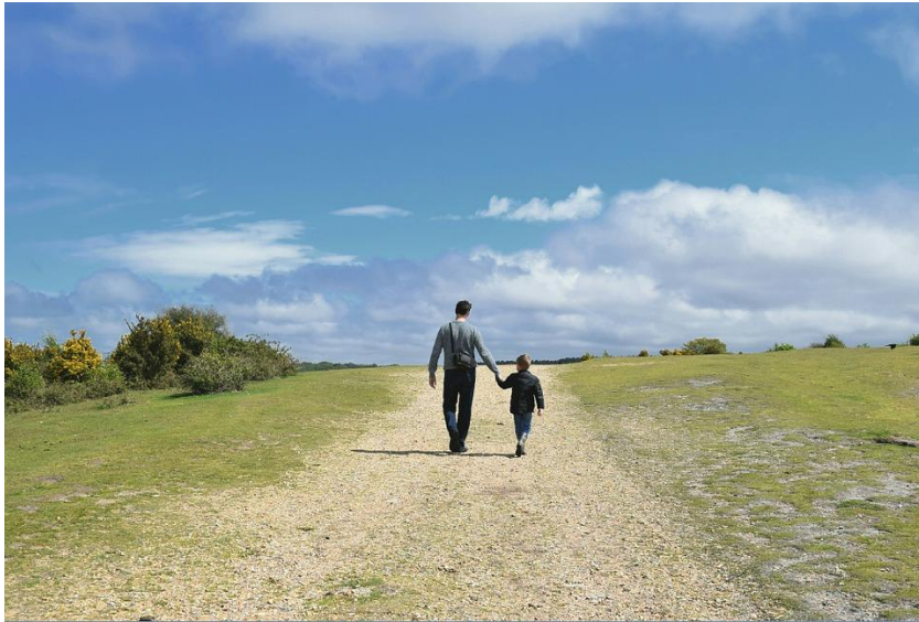
3-رەسىم: دەۋەت قىلىش يولىغا تەكلىپ قىلىشتۇر.

ئاللاھ يۇقىرىدىكى ئايەتتە «پەرۋەردىگارىڭنىڭ يولىغا ئەقىل-پاراسەت بىلەن دەۋەت قىلغىن»، دەيدۇ. بىز ئادەتتە كىشىلەرنى بىرەر يولغا تەكلىپ قىلمايمىز، بەلكى ئۇلارنى بىر مەنزىلگە تەكلىپ قىلىمىز. ئەمما ئاللاھ بۇ يەردە بىزگە كىشىلەرنى بىر يولغا تەكلىپ قىلىشنى دەۋاتىدۇ. بۇ كالايدا ئىنتايىن كۆپ ھېكمەت بار بولۇپ، ئۇ ئىسلامدىكى ئەڭ كۈچلۈك ھەقىقەتلەرنىڭ بىرى بولۇپ ھېسابلىنىدۇ. كۆپلىگەن كىشىلەر بۇ ھەقىقەتنى بىلمەيدۇ. ئىسلامنى ئۆگىنىۋاتقان كىشىلەر ئۆزلىرىدىكى ئىلگىرىلەشنىڭ ئاستا بولۇۋاتقانلىقىدىن نارازى بولىدۇ، ھەمدە قىممەت ياكى سانغىلا ئەھمىيەت بېرىدۇ. «ھازىرغىچە ھېچ قانچە نەرسە ئۆگىنەلمىدىم»، دەپ ئويلايدۇ.