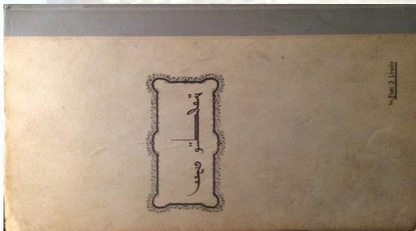
<Qutadghu Bilik> Wiyna nusxisi, 1942-yil Istanbul Neshiri (faksimal)